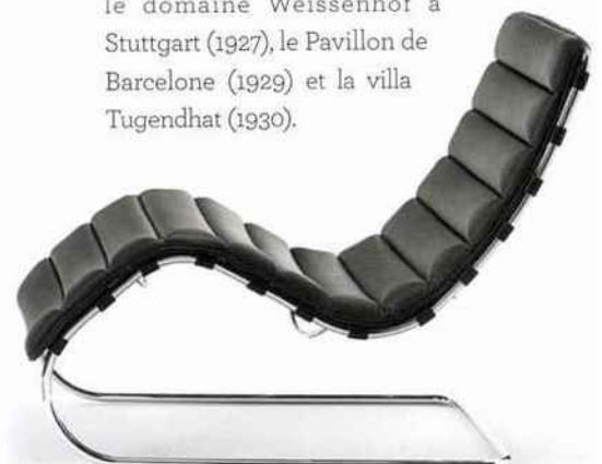
Collection MR, Mies van der Rohe. © Knoll