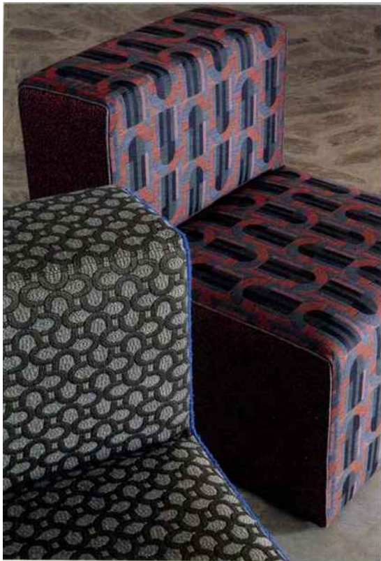
Revêtement collections Mouvement et Bauhaus, Créations Métaphores.