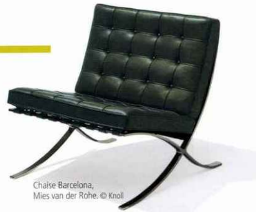
Chaise Barcelona, Mies van der Rohe.

pour cette année 2019 une version en série limitée (365 pièces). La collection MR est également le fruit de l'association entre l'artiste allemand et l'éditeur américain. Produite par l'entreprise depuis 1964, elle s'enrichit cette année avec l'ajout de nouvelles variantes de revêtements en tissu et en cuir. Dès la dernière édition de l'IMM de Cologne et au Salon du meuble de Milan, Knoll fête à sa façon le centenaire du Bauhaus. L'éditeur a ainsi fait appel à OMA, le studio cofondé par l'architecte néerlandais Rem Koolhaas, afin de réaliser une scénographie