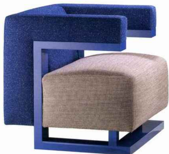
Tecta, fauteuil F51, Katrin Greiling, modèle original Walter Gropius.

pièces en série pour toucher l'ensemble de la population. On retrouve ces mêmes considérations dans d'autres mouvements artistiques de la fin du XIX e et du début du XX e siècle (l'Art nouveau en France, les Arts and Crafts en Angleterre...). Une différence majeure les distingue cependant. Si l'ornementation est souvent