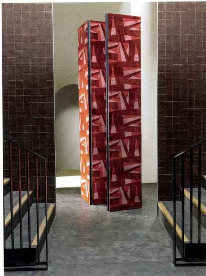
Revêtement Vassily, Créations Métaphores.